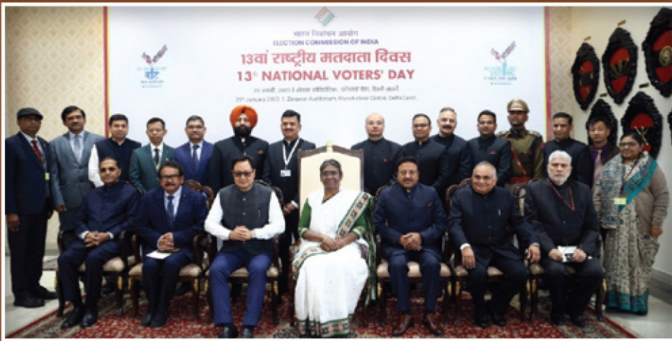
ബഹു. രാഷ്ട്രപതി തിരഞ്ഞെടുപ്പ് കമ്മീഷണർ എന്നിവർക്കൊപ്പം ദേശീയ തലത്തിൽ മികച്ച തിരഞ്ഞെടുപ്പ് പ്രവർത്തനങ്ങളുടെ അവാർഡ് ജേതാക്കൾ

എല്ലാ വർഷവും ജനുവരി 25 ഇന്ത്യൻ തിരഞ്ഞെടുപ്പ് കമ്മീഷൻ ദേശീയ സമ്മതിദായക ദിനം ആഘോഷിക്കുന്നു. ദേശീയ, സംസ്ഥാന, ജില്ല, ബുക്ക് തലങ്ങളിൽ നടത്തുന്ന പരിപാടികളുടെ തിരഞ്ഞെടുപ്പ് പങ്കാളിത്തവും, അവബോധവും പ്രോത്സാഹിപ്പിക്കുകയാണ് ലക്ഷ്യം. തിരഞ്ഞെടുപ്പ് പ്രാധാന്യം തിരിച്ചറിയുന്നതിനായി രാജ്യമെമ്പാടും നടത്തിയ ആഘോഷങ്ങളുടെ ചില ചിത്രങ്ങളാണ് ചുവടെ.