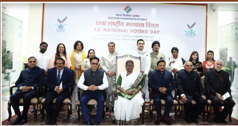
ബഹു. രാഷ്ട്രപതി, തിരഞ്ഞെടുപ്പ് കമ്മീഷണർ എന്നിവർക്കൊപ്പം ECI ഗാനത്തിലെ പ്രമുഖർ